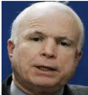
Mc Caine o la conveniencia

Kennedy una de las iniciativas migratorias más avanzadas que se recuerden, pero no se aprobó. Tiempo después, cuando Mc Caine fue postulado candidato presidencial del partido republicano, no obstante que visitó nuestro país y acudió a visitar a la Virgen de Guadalupe, su discurso a favor de los migrantes para esta época ya había menguado.