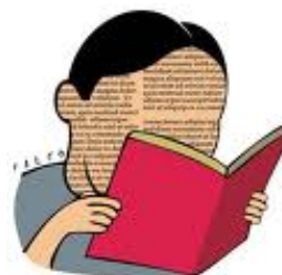
Información es poder

Cada vez que se renueva el gobierno en México o en Estados Unidos, las expectativas mexicanas sobre una mejor relación entre ambos países surgen inevitables. El problema es que esta natural aspiración, casi nunca ha estado acompañada de una estrategia integral que contemple un diagnóstico objetivo y sistemático sobre la realidad de ese país, sus prioridades domésticas e internacionales, sus fortalezas y debilidades, y una bitácora de su comportamiento hacia México en los temas que nos interesan. Ellos lo saben todo de nosotros, nosotros desconocemos casi todo de ese país.