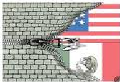
Desarrollo asimétrico, vecindad incómoda

La pregunta es obligada: ¿De qué manera sortear los embates que el gobierno norteamericano asesta a nuestro país cada vez que le viene en gana? ¿Qué estrategia tendría que seguir México para lograr resultados positivos y tangibles en nuestra relación asimétrica con Estados Unidos?