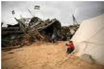
Crimen de lesa humanidad

A ver, Robert Fisk, el grandísimo osado y temerario reportero de The Independent, quien me ha estremecido incesantemente con sus artículos sobre las guerras en el mundo entero, mi ideal de periodista contemporáneo por antonomasia, autor del estruendoso relato La Cobardía de los Políticos sobre el cruento asalto de piratas contemporáneos de los israelitas sobre la flotilla de barcos llevando auxilio, comida, pan, miel, leche, harina, agua, manteca, dátiles, uvas, a una humanidad muerta casi de hambre en Gaza por años. Iban a calmar la desesperación de palestinos sometidos a un bloqueo increíble desde 2007.