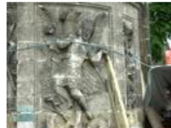
Destrucción del Patrimonio

En su expresión más simple, el Estado es la organización de las personas que habitan en un territorio, tienen un pasado común y acuerdan ciertas normas de comportamiento para vivir en paz y con seguridad. Cuando la gente acata las leyes y las autoridades las hacen cumplir, se dice que existe un Estado de Derecho. ¿Esto es lo que se está perdiendo en México con alarmante rapidez? ¿Será por eso que la gente no confía en el gobierno ni en las instituciones, sobre todo de procuración de justicia?