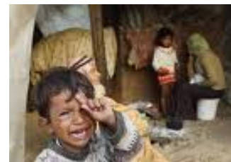
La imbecilidad de la guerra

demás ya se murieron, y hasta mi cumpleaños se pronuncia como si nada, ya el dato sin herir ni nada. Y aunque me quiera morir al oírlo, por costumbre, hasta existen los homenajes como si todos hubiéramos nacido en el mismo año. Pero no quería escribir de "la edad" sino de lo difícil que es seguir respirando el aire de este siglo más inhóspito y nauseabundo.