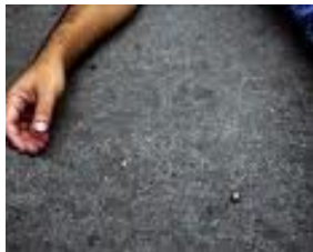
Asesinado en su propio país

No se trata de una violación a los derechos humanos de los mexicanos en Estados Unidos, sino de un acto criminal violatorio de la soberanía y de la integridad territorial de México, lo que es mucho más grave y cuyo manejo tendría que corresponder a esa gravedad.