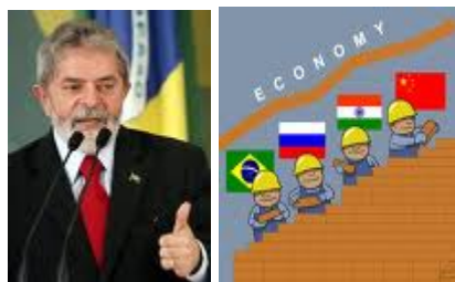
Lula y el exitoso BRIC

Mucho tendría que aprender el actual gobierno del ejemplo de Brasil, cuya prestigiosa diplomacia de Itamarati, ha sabido sortear con acierto vendavales cruentos y prolongados, mostrando gran capacidad para valorar su entorno con objetividad y para actuar en base a estrategias alternativas de gran calado, que le han permitido en pocos años, no sólo recuperarse de sus décadas de crisis económicas y políticas, sino fortalecer notablemente su economía.